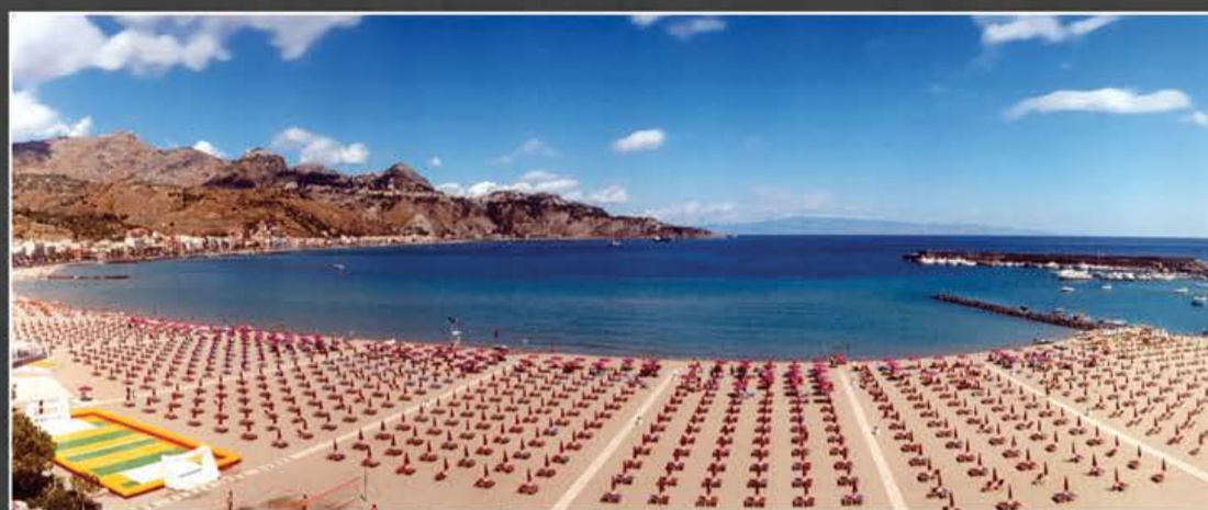
Spiaggia Lido di Naxos

UN'OPPORTUNITÀ UNICA PER VISITARE E SCOPRIRE LUOGHI, ARTE, TRADIZIONI E CULTURA, IN UNO DEI PAESI PIÙ BELLI AL MONDO.