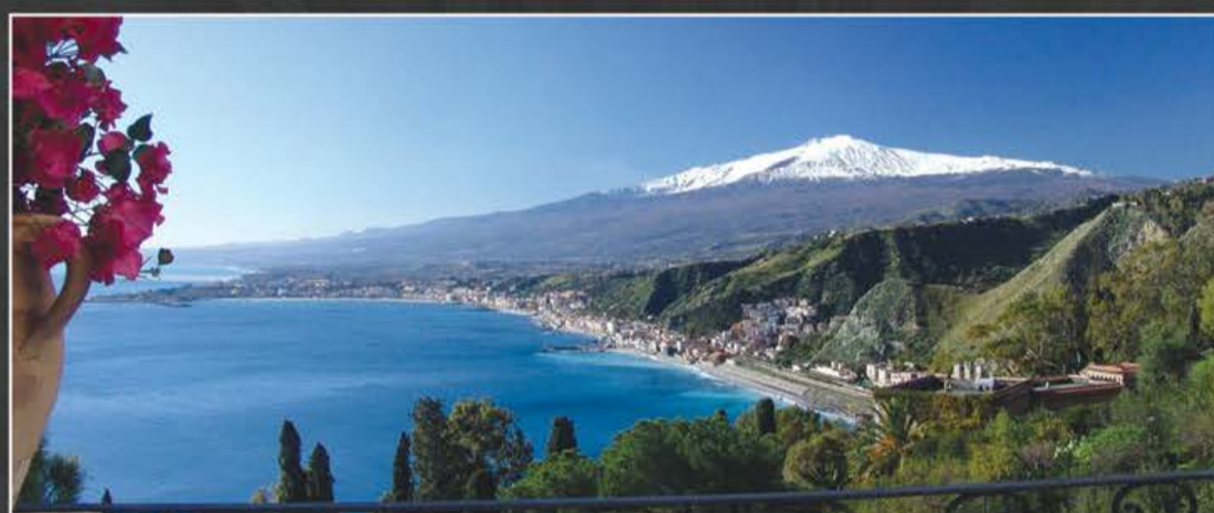
Baia di Giardini Naxos con vista Etna